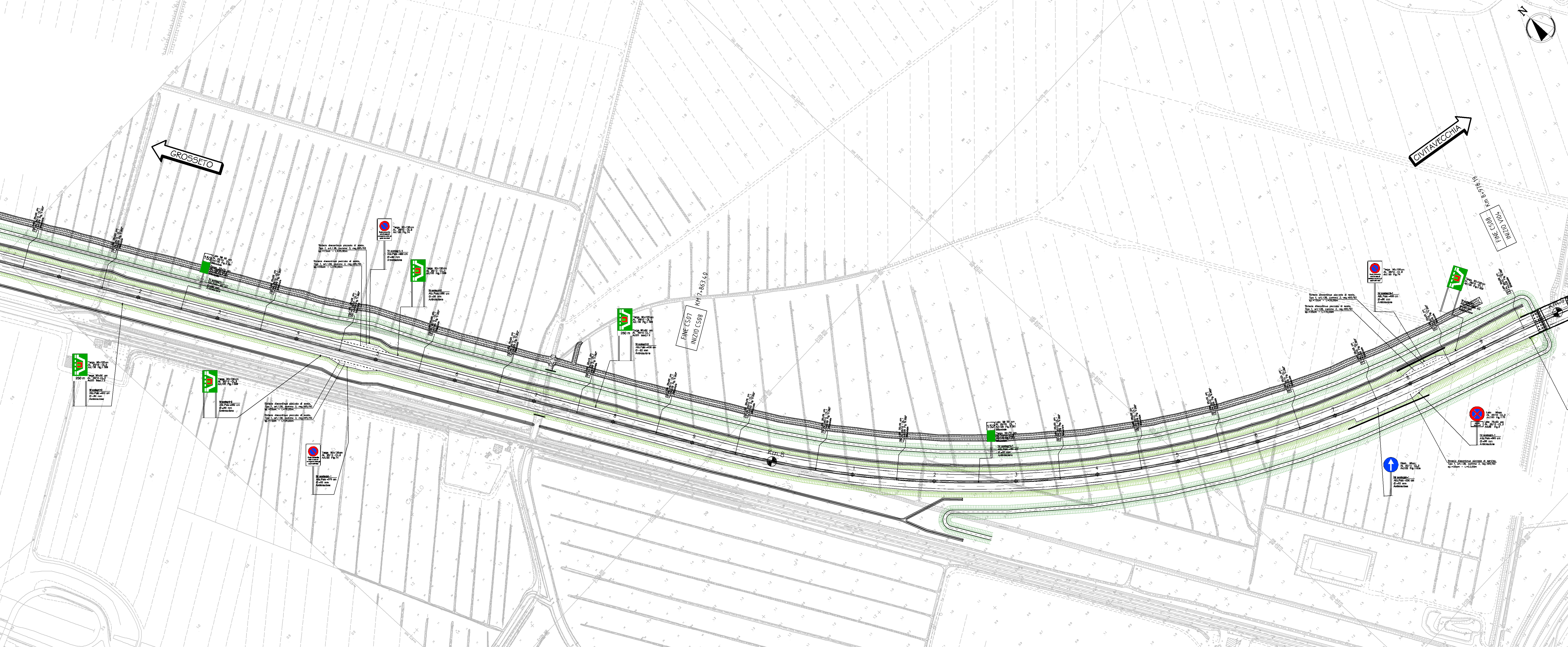
Planimetria di segnaletica Scala 1:2000