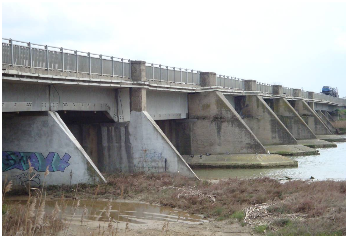
Foto 5 – Vista laterale da valle – particolare variazione di altezza delle travi