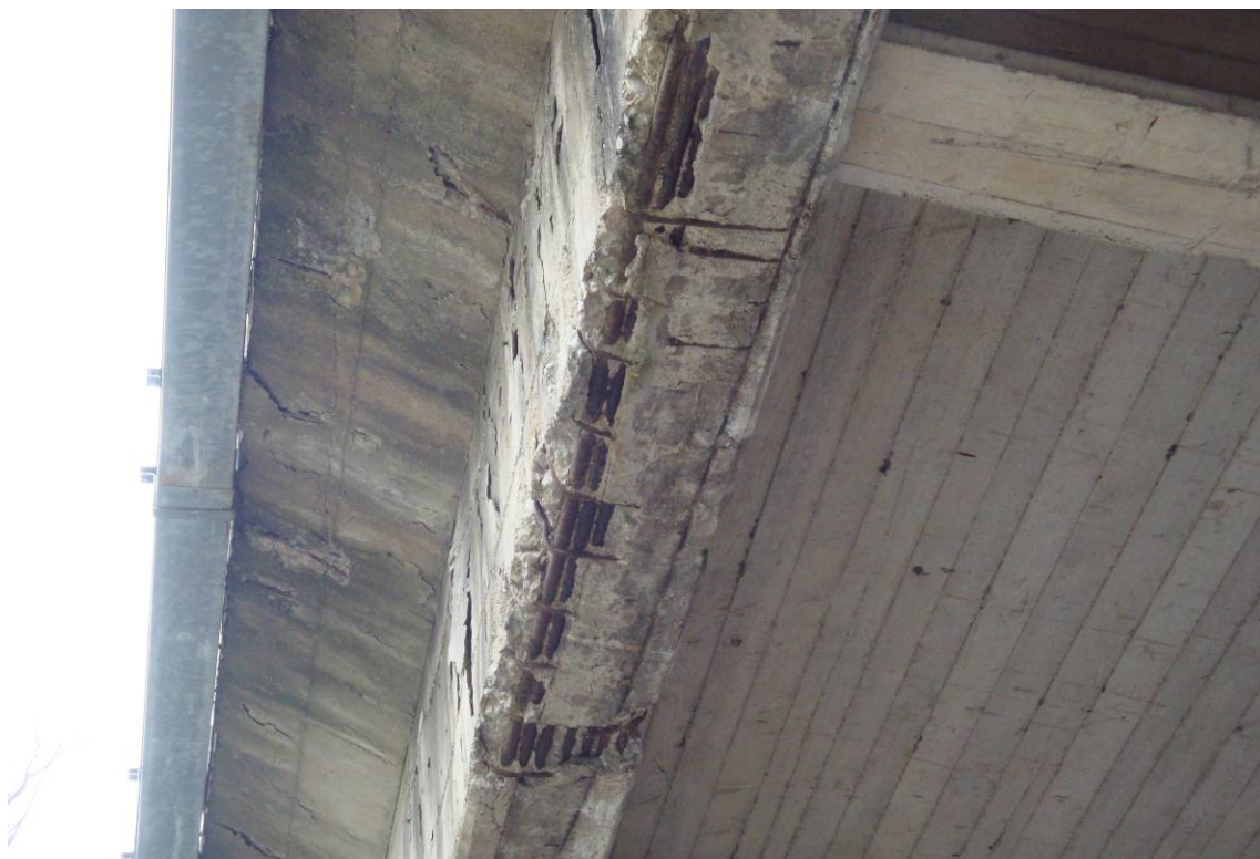
Foto 7 – Particolare intradosso impalcato –degrado trave di bordo