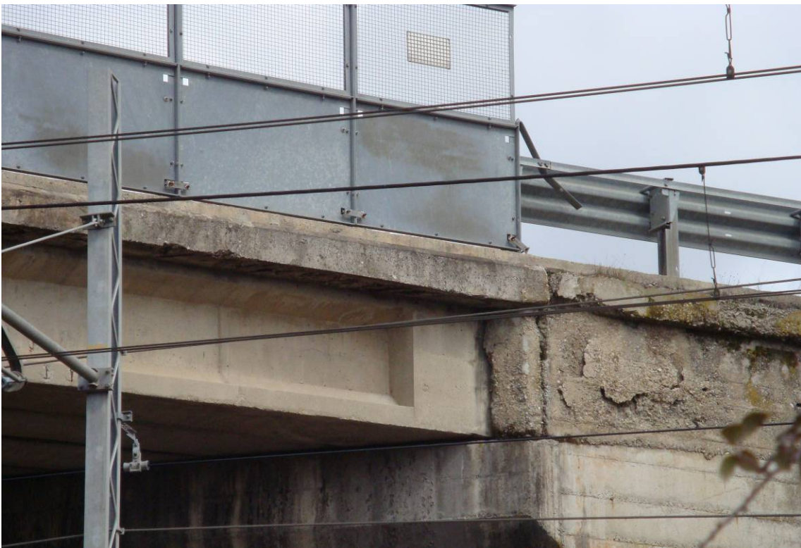
Foto 6 – Muro frontale della spalla – particolare saggi conoscitivi