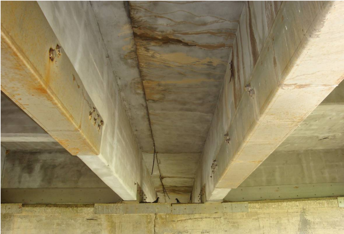
Foto 7 – Vista intradosso – giunto tra i 2 impalcati – placcaggio travi