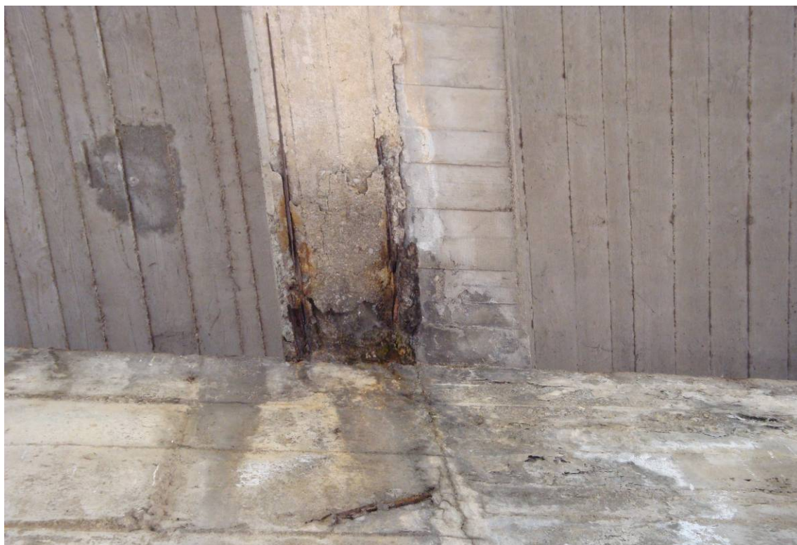
Foto 5 – particolare intradosso impalcato - appoggio trave doppia