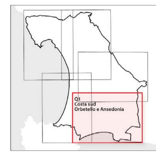
TAVOLA SSS.06 - Quadro 1 Il progetto di piano: disciplina e azioni